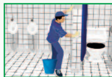
Sociétés de nettoyage