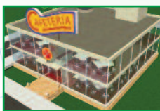
Cafés - Hôtels Restaurants