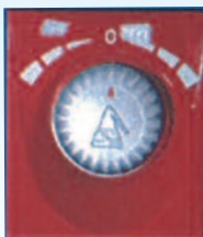
Double réglage Produit