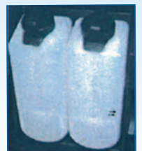
2 Réservoirs à Produits