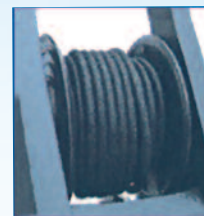
Enrouleur Intégré Flexible 12 Mètres