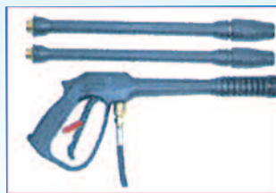
Poignée + rallonge + lance multiréglages + rotabuse