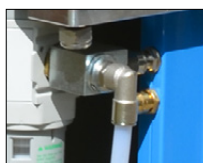
Vanne d'échappement rapide