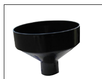
Entonnoir de remplissage