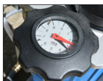
Cadran de réglage