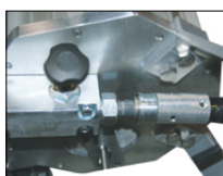
Système QUICK CONNECT