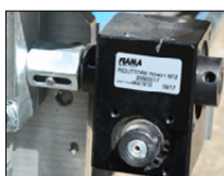
Nouvelle vanne de mélange