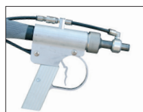
HELIX pistool + Leiding