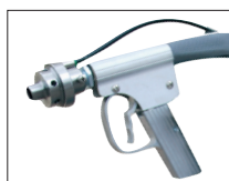
H2O pistool + Leiding